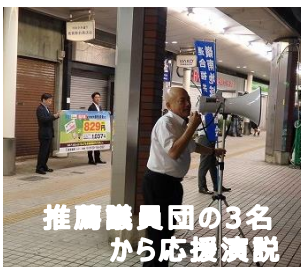
推薦議員団の3名 から応援演説