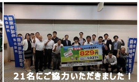
21名にご協力いただきました！

9月25日(水)、10月4日から福井県最低賃金が改定されるのを前に、街頭演説や「新最低賃金時間額」等が書かれたチラシ入りのティッシュを配布し、白銀交差点周辺で周知活動を行いました。