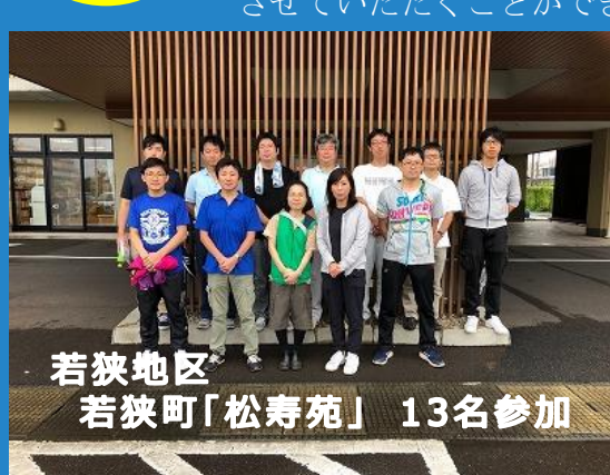
若狭地区 若狭町「松寿苑」 13名参加