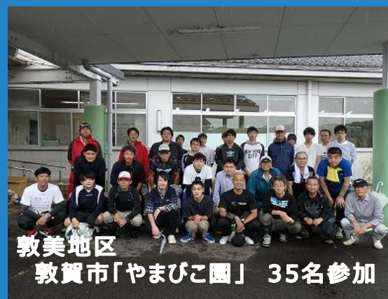
敦美地区 敦賀市「やまびこ園」 35名参加

「地域に根差した顔の見える活動」の一環として春と秋の年二回、長年継続して行っている活動です。今回も各地区とも多くの組合員皆様のご協力をいただき、作業させていただきました。