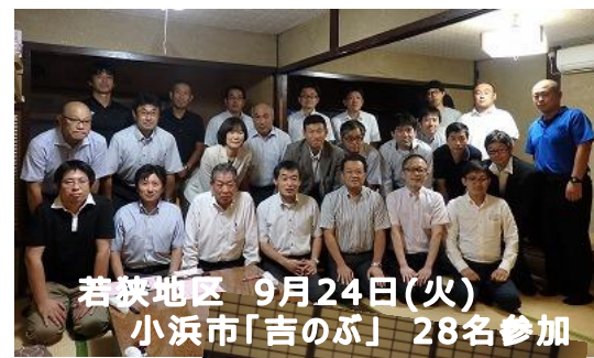
若狭地区 9月24日(火) 小浜市「吉のぶ」 28名参加