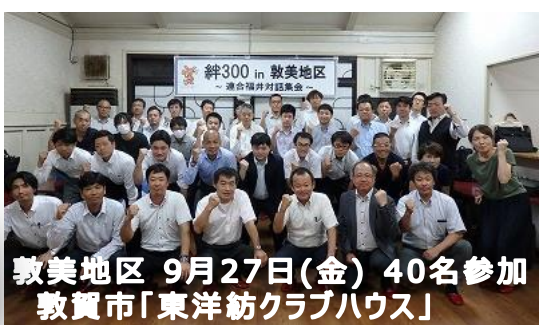
敦美地区 9月27日(金) 40名参加 敦賀市「東洋紡クラブハウス」