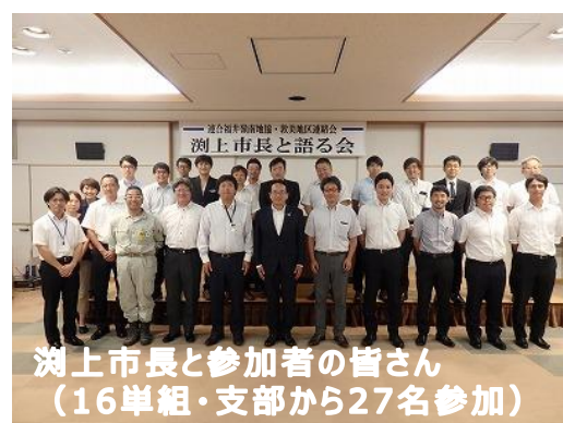
洲上市長と参加者の皆さん (16単組・支部から27名参加)