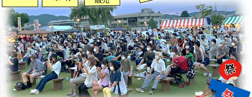
(第36回丹南地区いきいき夏まつりの様子)