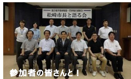
参加者の皆さんと!