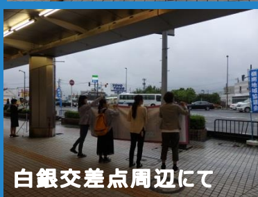
白銀交差点周辺にて

嶺南地協役員、女性委員会、推薦議員から協力を受けて、マイクリレーやチラシ配り。男女平等・男女共同参画推進に向けて!