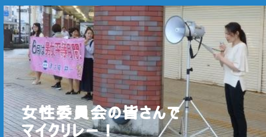
女性委員会の皆さんでマイクリレー!