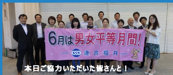
本日ご協力いただいた皆さんと!