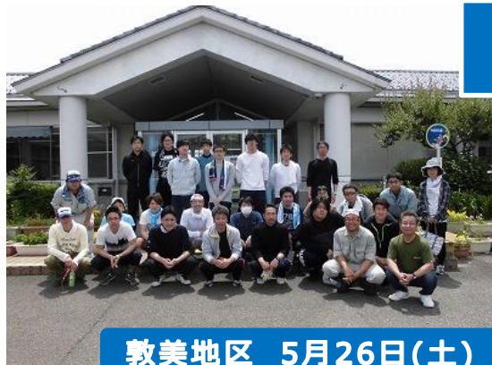
敦美地区 5月26日(土) 敦賀市「やまびこ園」 32名参加