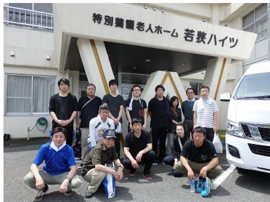
若狭地区 5月26日(土) 小浜市「若狭ハイツ」 15名参加