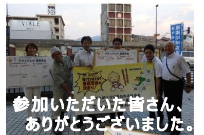
参加いただいた皆さん、 ありがとうございました。

7月26日(木)、最賃改定審議スタートにあたり、福井県最低賃金の大幅な引き上げをめざし、社会的なニーズや機運を高めるための啓発活動として実施しました。