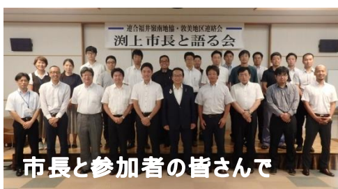
市長と参加者の皆さんで