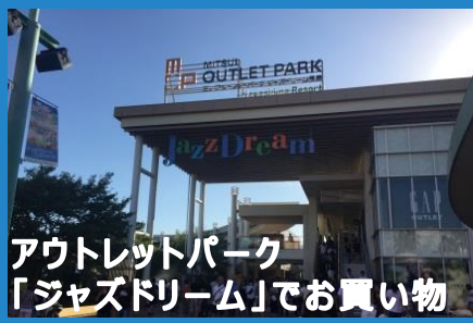
アウトレットパーク 「ジャズドリーム」でお買い物