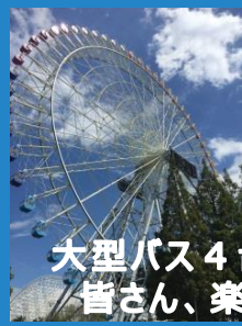
大型バス4台での日帰りバス旅行 皆さん、楽しい一日を過ごしていただけたようでした。