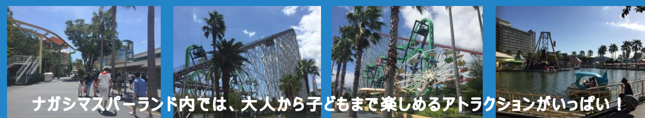
ナガシマスパーランド内では、大人から子どもまで楽しめるアトラクションがいっぱい！