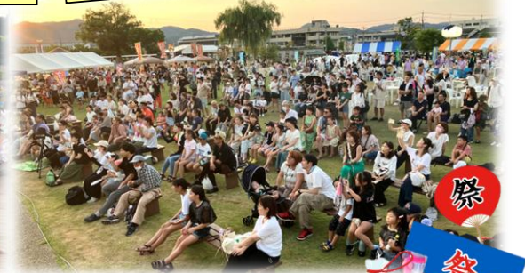
(第38回丹南地区いきいき夏まつりの様子)