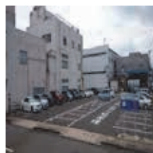
＜約50台収容の駐車場＞