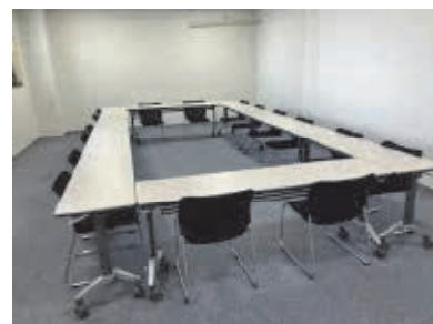
1階 103号室 24名