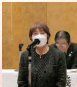
退任挨拶をする 政所副会長