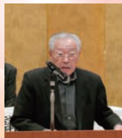
退任挨拶をする 青山監査員