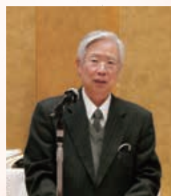
議事の提案をする 毛利事務局長