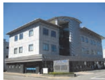
＜ユニオンプラザ福井外観＞