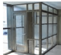
＜会館3階喫煙ルーム＞